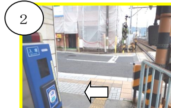
2 改札（1箇所）出て左側（山手）へ