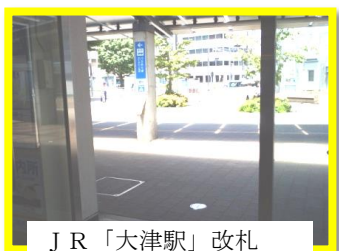
JR「大津駅」改札 北口を出る