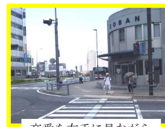
交番を右手に見ながら 直進する。