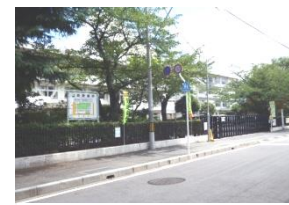
右折後すぐに学校が 見えます