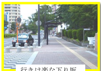
行きは楽な下り坂