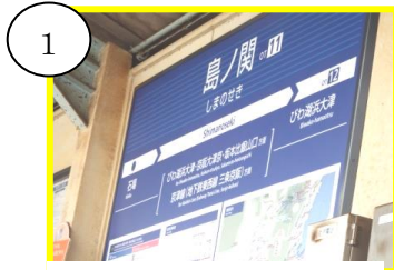
1 京阪「島ノ関駅」下車