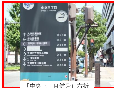
「中央三丁目信号」右折